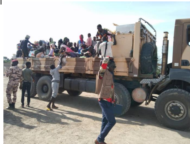
Arrivées des sinistrés sur le site de Koundoul (aidés par le génie militaire)