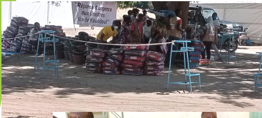
Appui à la distribution des NFI au site de Koundoul

L'ONG AFRIC'OMPETENCE participe activement à la mise à jour des listes des bénéficiaires, propose des aires de distribution, apporte son soutien à la sécurisation des opérations de distribution, assure le suivi des opérations de distribution (Food distribution monitoring FBM), évalue de manière synoptique le résultat de l'opération, vulgarise les informations afférentes aux opérations en terme de données quantitatives et qualitatives sur la plateforme de Gestion inondation Humanitaire.