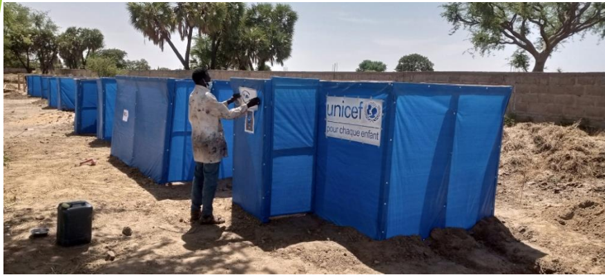
Suivi des travaux de construction des latrines

AFRICOMPÉTENCE, gestionnaire du site fort de ses expériences en la matière, met en œuvre des activités favorisant l'amélioration des conditions d'hygiène et la participation communautaire à travers des formations sur les thèmes tels que les risques liés à la défécation à l'air libre, la technique d'évacuation des eaux usées, la gestion des déchets ménagers, les gestes et pratiques après utilisation des toilettes, la gestion de l'environnement pour un bien être assuré ; des sensibilisations de proximité et d'exercices pratiques auprès des sinistrés en vue d'une gestion saine des différentes structures Wash (douches, latrines points d'eau, bac à ordures) ; leur faire comprendre la nécessité de les entretenir ; et quel est le danger lié à la mauvaise gestion des déchets solides et liquides produits par les ménages.