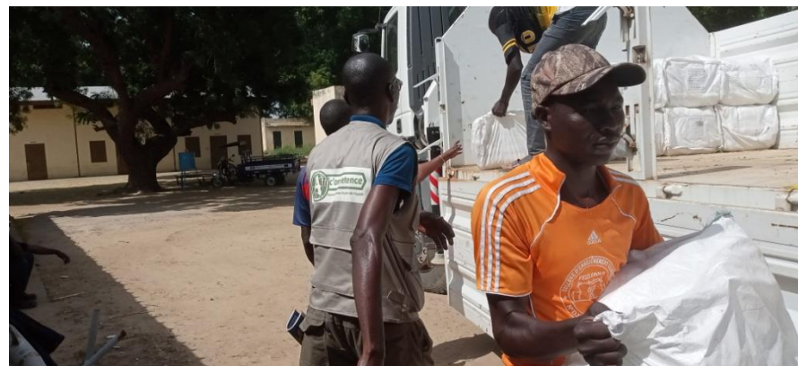
Appui à la distribution des kits de dignité aux bénéficiaires « 16 jours d'activisme » UNFPA/Afric'ompetence