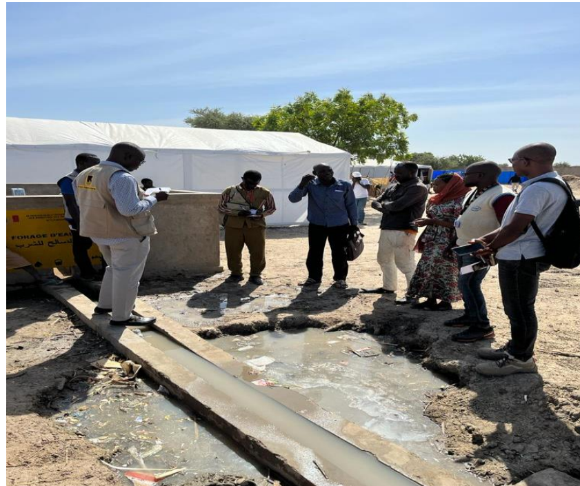
Forage avec pompe à motricité humaine (problème du système d'évacuation des eaux usées)