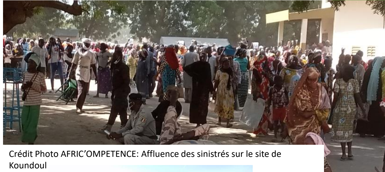
Affluence des sinistrés sur le site de Koundoul

La situation des inondations a mobilisé en urgence à Koundoul dans le Département du Chari-Baguirmi (25 km de la capitale) le 17/10/2022 une mission conjointe des partenaires au rang desquels, UNHCR, AFRICOMPETENCE, CRT et le Ministère du Genre et de la Solidarité Nationale. Il ressort que plusieurs ménages se retrouvent exposés sous les arbres à l'air libre privés de lumière, d'eau potable, de nourritures. La plus part est sans couchage, sans couverture. Les enfants, les femmes à situation spécifique (grossesse, allaitante etc.) et les personnes âgées constituaient une poche de vulnérabilité accentuée. Les conditions d'hygiène sont particulièrement préoccupantes (défécation à l'air libre, risque d'épidémie de choléra, etc.).