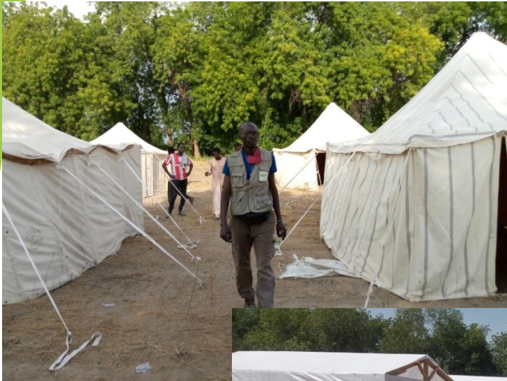
Suivi des travaux de construction des abris

En sa qualité de gestionnaire du site, l'ONG s'assure que les besoins des personnes déplacées (abris, Wash, etc.) sont pourvus et satisfaits et qu'il n'y a de lacunes ou de chevauchement dans les responsabilités ou les interventions. En plus, elle apporte un appui multiforme dans la réalisation de la construction des abris. Elle s'assure du respect des normes standards de construction qui répondent aux besoins de protection, elle fait le suivi des différentes phases des travaux, elle fait de plaidoyer en cas de difficultés en vue d'une mobilisation pour une réponse prompte et conséquente.