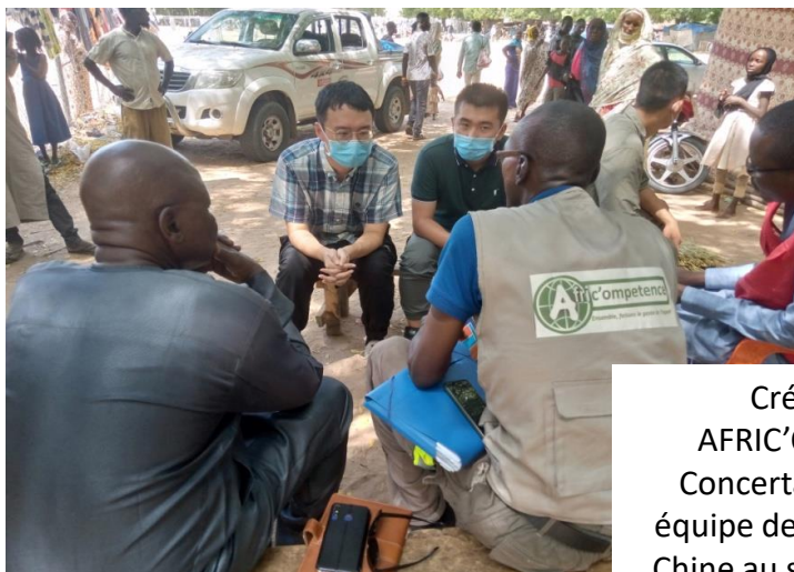
Concertation avec une équipe de l'ambassade de Chine au site de Koundoul