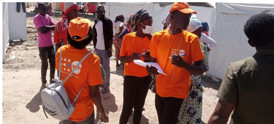
Activité de sensibilisation « 16 jours d'activisme » VBG (Afric'ompetence/ UNFPA)

AFRIC'OMPETENCE a Co-organisé avec UNFPA une activité de sensibilisation dénommée: « 16 jours d'activisme sur le genre et les violences faites aux femmes », sur le site. En plus de ça, d'autres sensibilisations de proximité (porte à porte), la création des canaux d'espoir, les formations relatives à la prévention des violences sexuelles et alertes précoces sont régulièrement organisées sur le site afin de stimuler au changement de comportement.