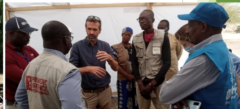
Concertation avec les partenaires pour action