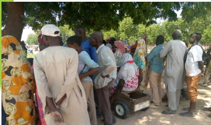
Mise en place des comités de gestion communautaire

Aussi, l'ONG assure la coordination et le suivi de la prestation des services et de la protection pour les personnes déplacées et de leur accès, ainsi que la maintenance des infrastructures.