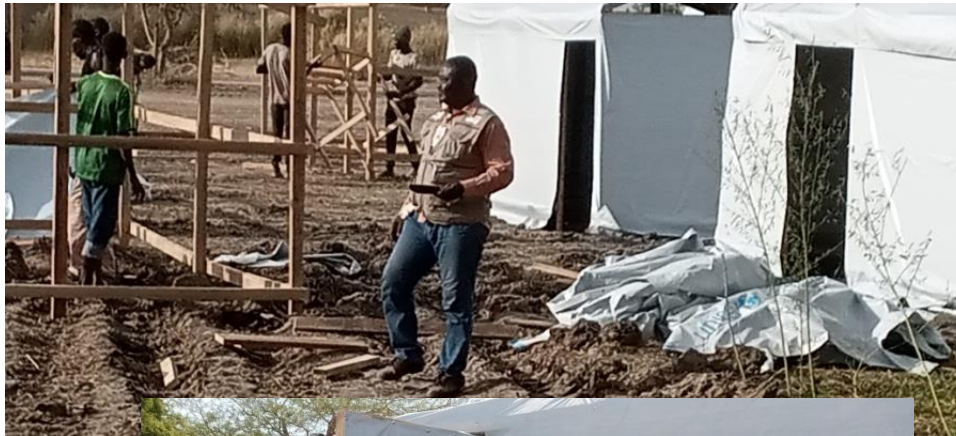
Suivi des travaux de construction des abris par le Chargé des opérations Afric'ompetence