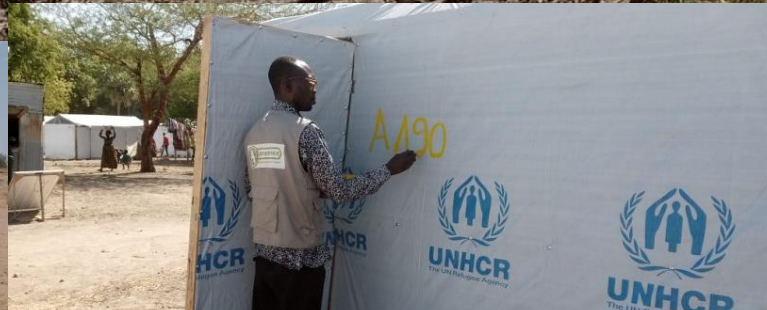
Marquage des abris par le camp manager Afric'ompetence